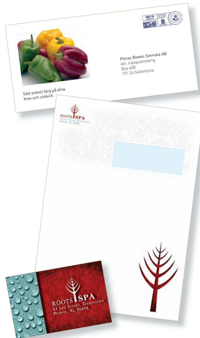
Exempel på kuvert, brevpapper och visitkort

Kuvertskrivaren levereras med skrivarhanteringsprogrammet IQueue som standard. Det har funktioner för exakta färginställningar, för att spara och hämta jobbinställningar som ofta används samt ett bibliotek med fördefinierade jobbinställningar. Med dessa får du perfekt resultat med många olika utskriftsmaterial och bildtyper. Det är enkelt att installera maskinen. Maskinen har inga komplicerade förbrukningsmaterial eller färgpatroner; bara integrerade kassetter precis som på en vanlig laserskrivare.