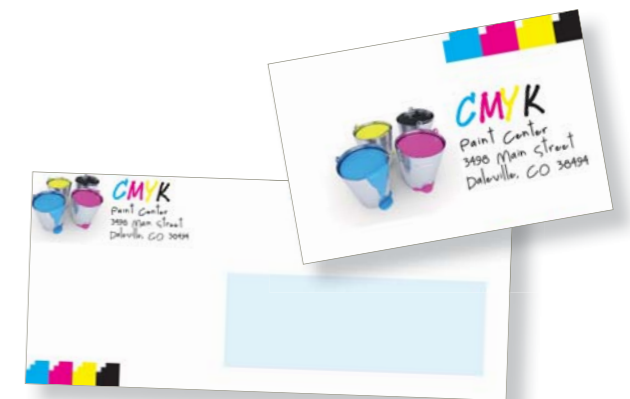
Exempel på kuvert och visitkort

Hög hastighet – skriver ut 36 sid/min i färg och 40 sid/min i svartvitt